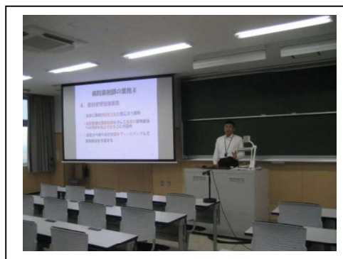
チーム医療の現状と教育支援について