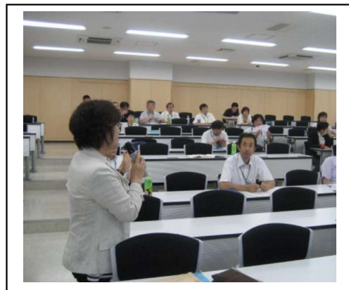
最後まで活発な討論が行われた