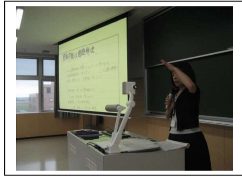
ワークショップ2：学部混成の5グループにより「今後のチーム医療を目指した教育支援の在り方」について、組織として実施可能な課題解決の具体策を提示した