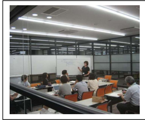
ワークショップ1：学部毎に「チーム医療の観点から見た教育支援の現状」を整理した