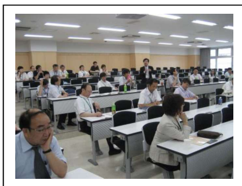
参加者の自己紹介