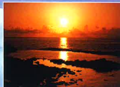
Sunset of Golden