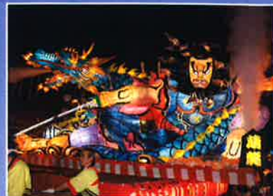
るもい呑涛まつり