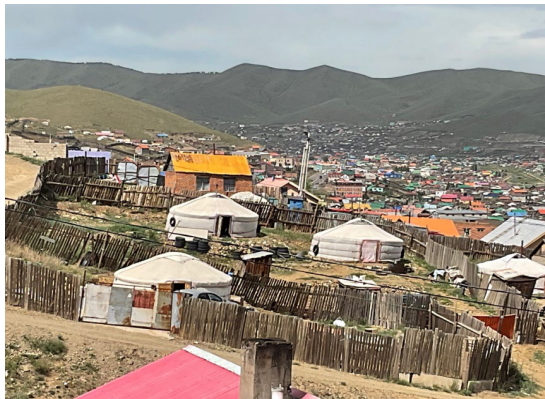
当事者インタビューを実施したチンゲルティ地区の街並み

以上の他、現地の大学（ウランバートル国際大学、モンゴル国立医科大学など）の研究者、さらには現地で活動するJICAのスタッフ等とも交流を図ることができ、今後のプロジェクトの推進に不可欠な人的なネットワークをつくることが出来たことは、大きな収穫であった。