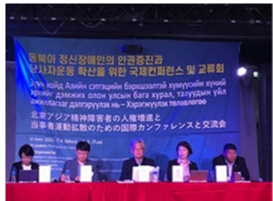
カンファレンスの様子