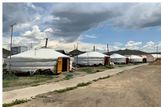
ゲルセンター（モンゴル国立精神医療センター内）の様子