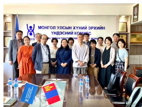
RIDRIK調査団、国立人権センターのスタッフ