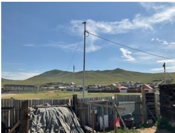
ウランバートル市内の集落